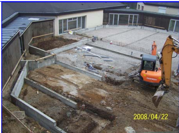
Chantier des fondations de la nouvelle salle polyvalente

Les travaux de rénovation de la Maison d'Accueil avancent ; à la place de l'ancienne terrasse, les fondations de la nouvelle salle polyvalente et d'une nouvelle unité permettant de reloger les résidents au fur et à mesure des travaux, sont en cours d'achèvement. Les trappes de désenfumage sont posées dans les galeries, les tuyauteries pour chauffage et eau chaude sont installées. La grande cheminée de la nouvelle chaudière arrivée sur une grande grue vient d'être posée ; ce sera dorénavant un chauffage au fuel, et pour la future extension, des pompes à chaleur. Les unités seront ramenées de 12 à 9 résidents (suppression des chambres à 3 lits); l'effectif passera à 62 lits ( au lieu de 48) ; tout est mis en œuvre pour ne pas perturber la vie quotidienne.