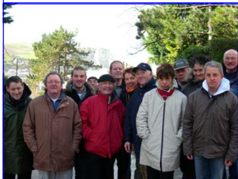
Les travailleurs de l'ESAT Porte Océane

Dans le cadre d'un projet tutoré par la professeur de sport adapté de l'ESAT Porte Océane, des rencontres ont eu lieu sur trois jours entre les travailleurs de l'ESAT et des associations havraises. Ces échanges autour du sport avaient pour objectifs de faire découvrir à nos usagers certains métiers (rencontre avec des enfants, association Vita-mine) et les activités existantes pour nos futurs retraités (échange avec l'Association Cœur et Santé), le thème central étant la socialisation.