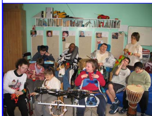
L'atelier de percussions

Proposé à raison d'une fois tous les quinze jours, cet atelier pourrait s'inscrire à plus long terme dans les échanges entre le Manoir d'Eprémèsnil et les Myosotis.